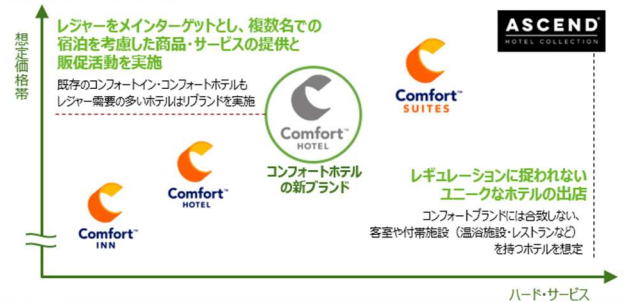
ブランドポジショニングイメージ

今後もこのブランドコンセプトを通して、旅行者に独自のホテル体験を提供することによって、地域経済の活性化と観光業の成長に寄与してまいります。